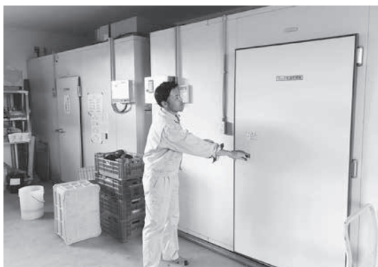
冷蔵庫（出荷を待つ作物などを保管）