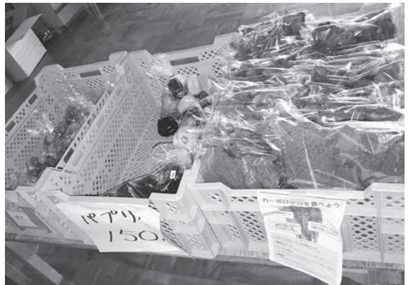
試験研究で栽培された作物は廃棄することなくセンターで販売している