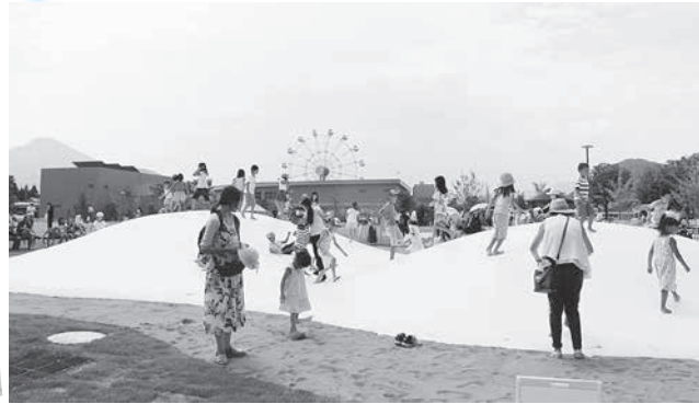
だるまちゃんとかみなりちゃんのみわふわ雲

とかみなりちゃん」の中で、だるまちゃんとかみなりちゃんが楽しそうに雲に乗ってかみなり公園へ向かうシーンをモチーフとしています。